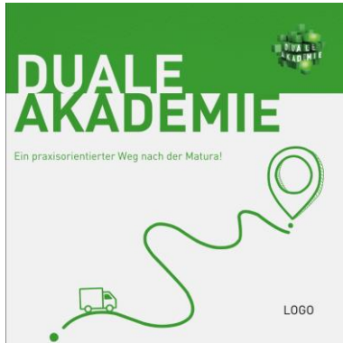
FB und IG Sujets