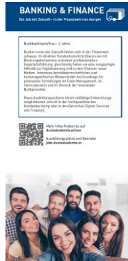
Detailinlays zum Druck